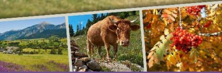
RANDONNÉES EN PYRÉNÉES-ORIENTALES